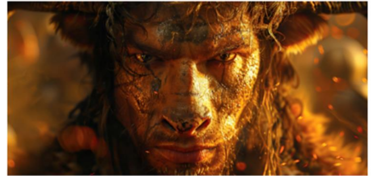
Emilie, portrait of a minotaur mythical monster fantasy, illustration [Generative AI].

Call for Papers – diMaG 3, 2026 – Mensch & Tier